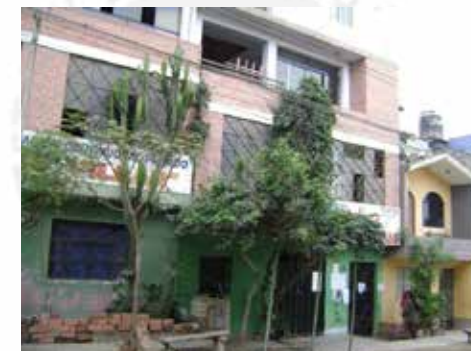
Foto fachada 1